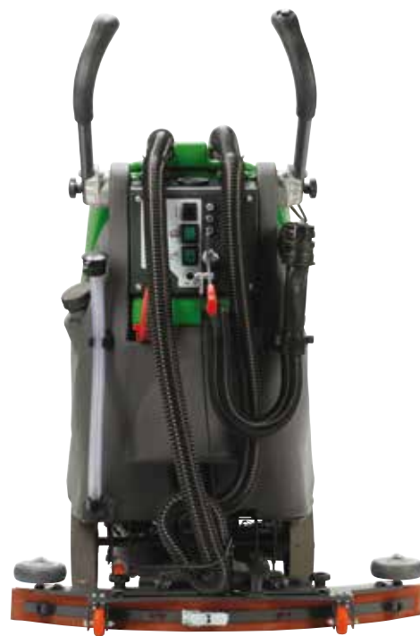
72 cm Gesamtbreite