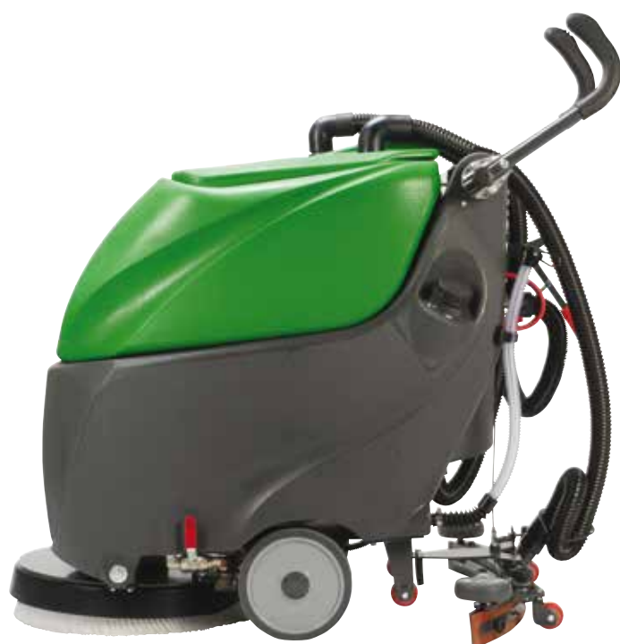
103 cm Gesamtlänge