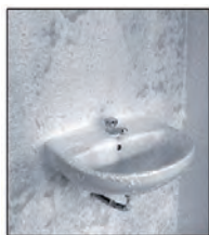
2. Chemische Einwirkung